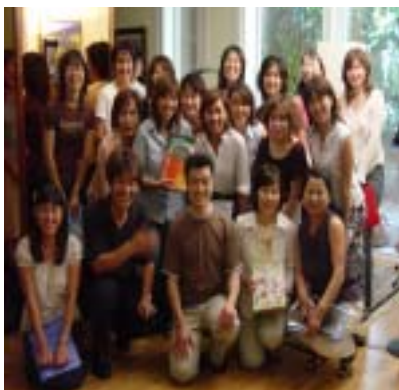
写真 在バルセロナの女声合唱団の方々と

2度目のヨーロッパでの合唱旅行。総勢25人。しかし旅行というものではなく、10日間合唱漬けの日々を過ごしてきました。いろんな国の人々と一緒に歌い、笑い、食事を共にしてきました。