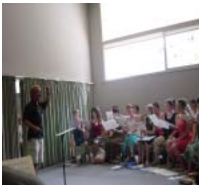
写真 ヤン先生のアトリエ風景