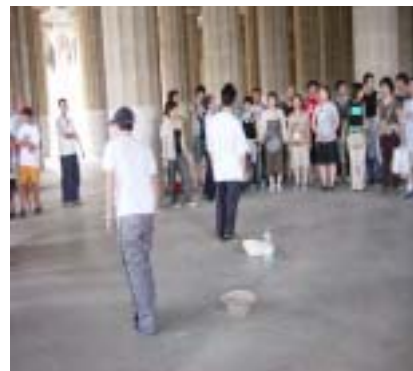
写真 グエル公園でのゲリラライブ