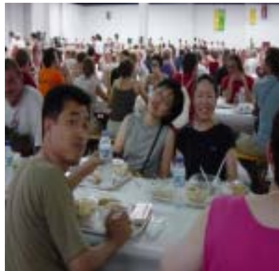
写真 3千人が一同に摂る昼食は圧巻です。