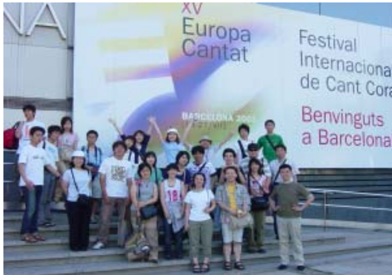
事務局のある Congress Hall 前で記念撮

ヨーロッパカンタートとは、3年に1度ヨーロッパで行われる世界規模の合唱人のための講習会です。