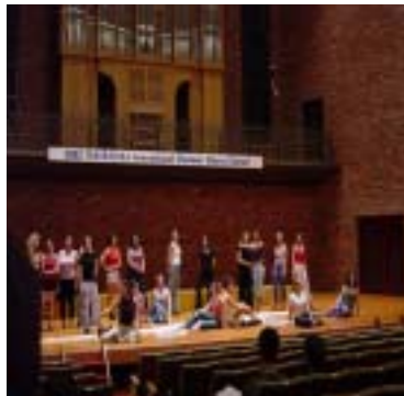
総合1位 Moran Chamber Choir (イスラエル)