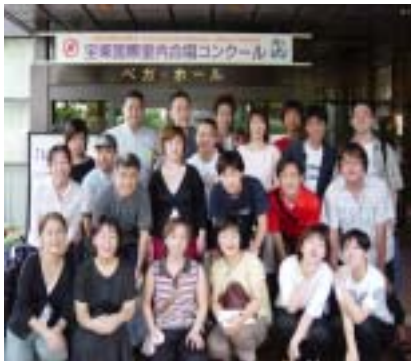
《E S T》のメンバー