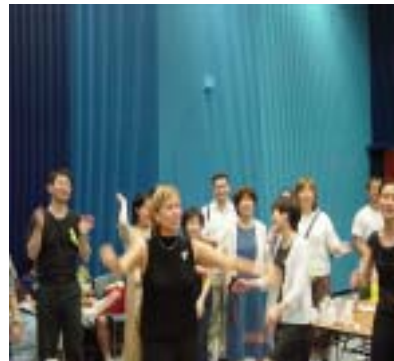
コンクール後に開催される交歓会